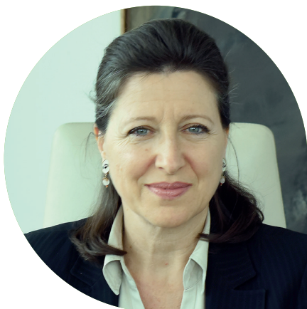
Agnès BUZYN Ministre des Solidarités et de la Santé