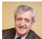
Charles-Éric Lemaigen Président de l'AdCF Assemblée des Communautés de France